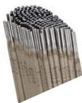
ELECTRODO FERRO 6013