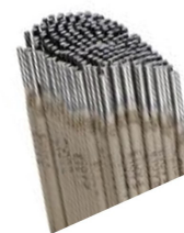
ELECTRODO FERRO 6013