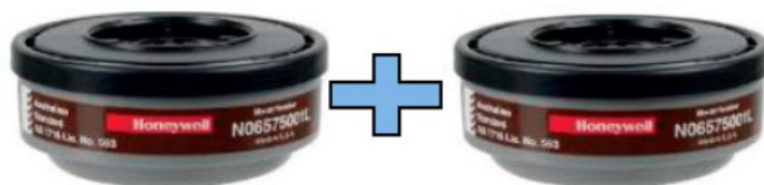
JG.2FILTROS A1 P/N5500