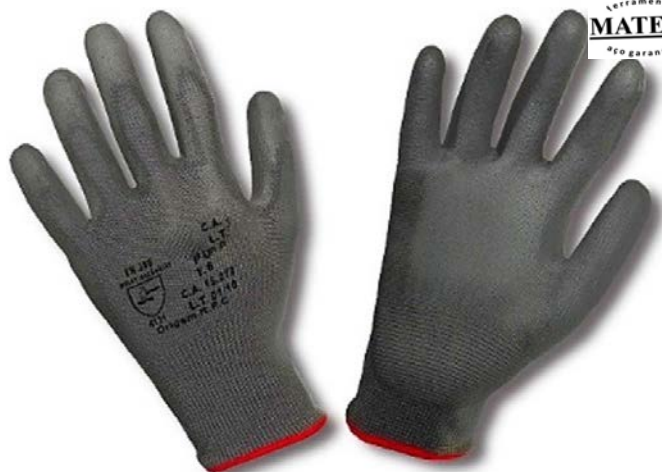
LUVA NITRIL CINZA / CINZA